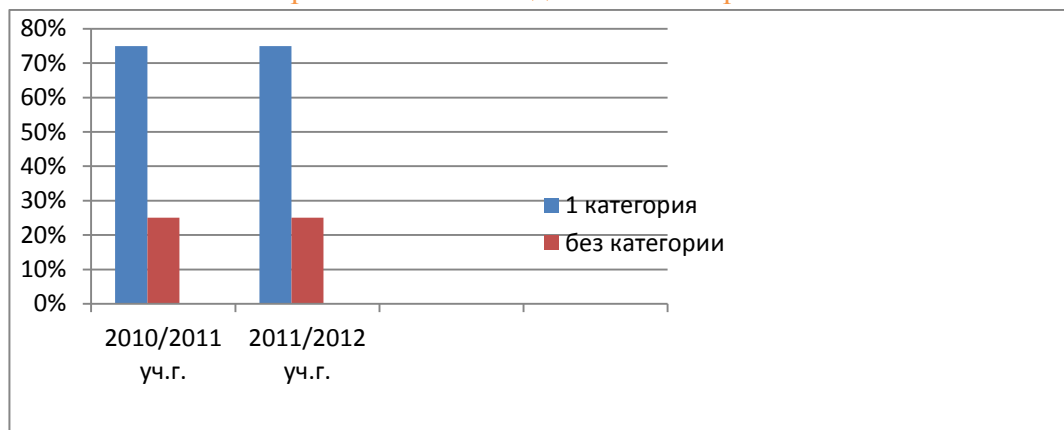
Категорийный состав педагогических работников.

Деятельность администрации школы направлена на усиление положительной мотивации педагогов, обеспечение благоприятного климата в коллективе. Немаловажное значение имеет работа с молодым специалистом по адаптации его к работе.